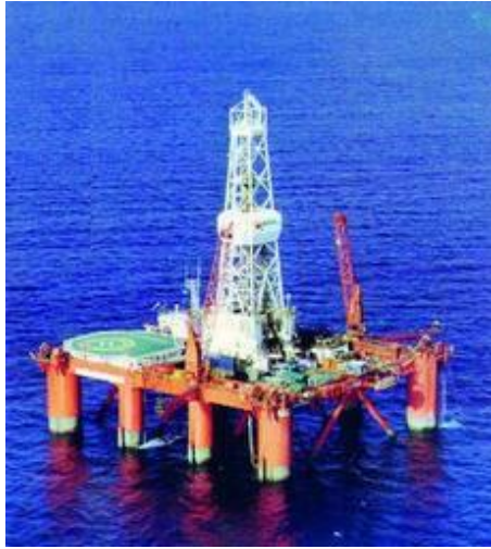
Plataforma Poseidón Norte, usada para la apertura de los pozos poseidon frente a las costas de Doñana.