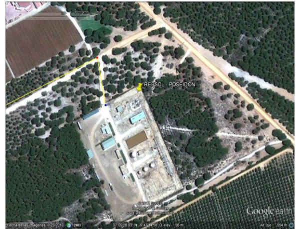
Planta de procesamiento Poseidón de REPSOL. Los gaseoductos discurren por zonas de especial conservación de Doñana y conectan con los de GAS NATURAL.

La Junta, de la misma manera que concede autorizaciones fraccionadas a GAS NATURAL, concedió hace un año la Autorización Ambiental Unificada a una NUEVA actividad parcial y fraccionada de REPSOL, el “Proyecto de Planta Móvil de Tratamientos de Aguas de Formación en la Base de Poseidón en Huelva (AAU/HU/007/15)” en Mazagón, una NUEVA depuradora de aguas contaminadas, aguas que anteriormente se vertían con camiones cisternas en Matalascañas y después en la depuradora municipal de Huelva, lo que fue denunciado por Mesa de la Ría a este Ayuntamiento y Aguas de Huelva hasta su paralización, lo cual también fue denunciado junto a los proyectos de Gas Natural, al Parlamento Europeo, UNESCO y al Defensor del Pueblo Español.