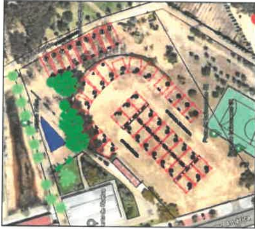
PLANO DE SITUACION