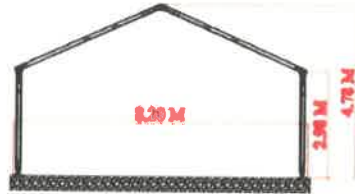
PORTADA CARPA DE 8M