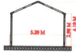
PORTADA CARPA DE 5M