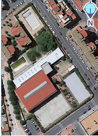
foto aérea de la situación de las edificaciones y construcciones (11/06/2016)

Esta es una copia impresa del documento electrónico (Ref: 592675 WTSKD-Y0A6W-8QWSL-AE56786DC65F6FEA48685A049852734CF68BFA2D) generada con la aplicación informática Firmadoc. El documento está FIRMADO. Mediante el código de verificación puede comprobar la validez de la firma electrónica de los documentos firmados en la dirección web que le proporciona la entidad emisora de este documento.