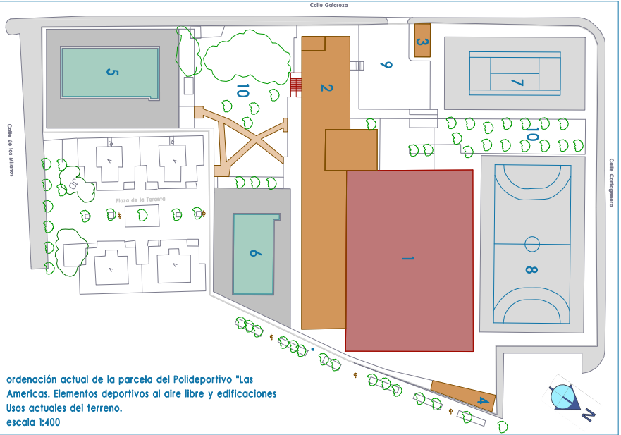
ordenación actual de la parcela del Polideportivo "Las Americas. Elementos deportivos al aire libre y edificaciones Usos actuales del terreno. escala 1:400