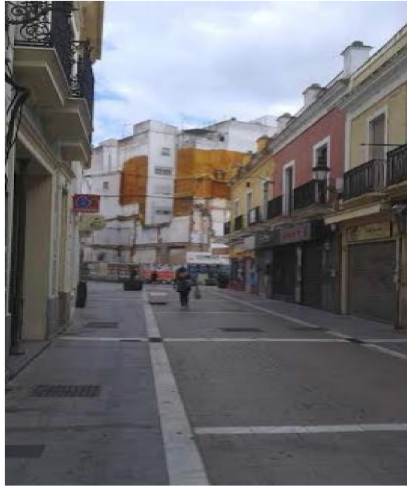
Calle Bocas con grave presencia de fondo de perspectiva en gran altura (ámbito de PERI). La altura de áticos en este punto debiera ser analizada en el planeamiento de desarrollo para la ocultación.

En atención a la aplicación del art. 14 de la LOUA, es parámetro de ordenación pormenorizada, propio de los planeamientos de desarrollo, la determinación de las alturas convenientes. Las circunstancias urbanas del perímetro edificado que conforma la gran manzana del PERI nº 2 "Mercado del Carmen", ponen de manifiesto la situación de descuido de interminables medianeras y testeros vistos que superan con creces esta altura. Es por ello que, dentro de los ratios marcados por la Aprobación Definitiva de la Modificación Puntual nº 22 del PGOU , se persigue un conjunto lo más unitario posible, con estudios de alzados unitarios a los efectos de ocultar testeros que superen esta altura métrica (5, 6 y hasta 8 plantas en el caso de la perspectiva en calle Bocas).