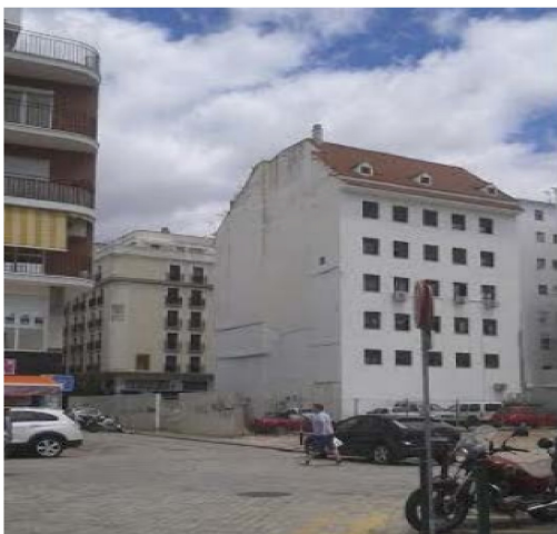
Edificio con fachada a calle Marina y graves testeros en relación con calle Carmen. La pieza adosada a esta medianera debiera incrementar puntualmente la altura generalizada del PERI.