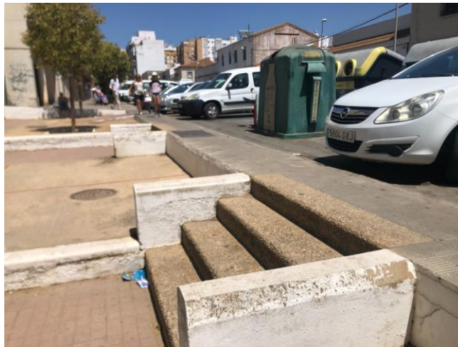
* Acera de la calle Argonautas.

Proponemos así la ampliación de esta calzada y el desplazamiento de las escaleras de acceso a la calle peatonal de Vila Real, así como la instalación de baradillas o cualquier otro método que aporte seguridad a esta acera por la que transitan muchos onubense en su día a día. Además, pensamos que en lo que tarde la puesta a punto de la misma, se instalen bolardos en el límite de la calzada para evitar que muchos vehículos terminen de obstaculizar por completo el tránsito por acera.