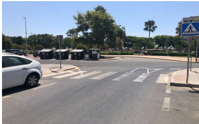
* Cruce de Calle Argonautas con Cristo del Amor.

La reordenación de la circulación en las calles Bonares y Argonautas es otra de las problemáticas que nos ha transmitido los vecinos. El Consistorio acometió en junio de 2020 labores para modificar los sentidos en las calles de esta zona con el fin de agilizar la circulación. Sin embargo al cambio a doble sentido de estas dos vías ha restado seguridad a los conductores que circulan por la zona puesto que en muchas partes de la calle el paso para dos coches es muy estrecho y se han llegado a producir varios choques entre los mismos. Sobre todo en algunos cruces donde solo hay espacio para un vehículo.