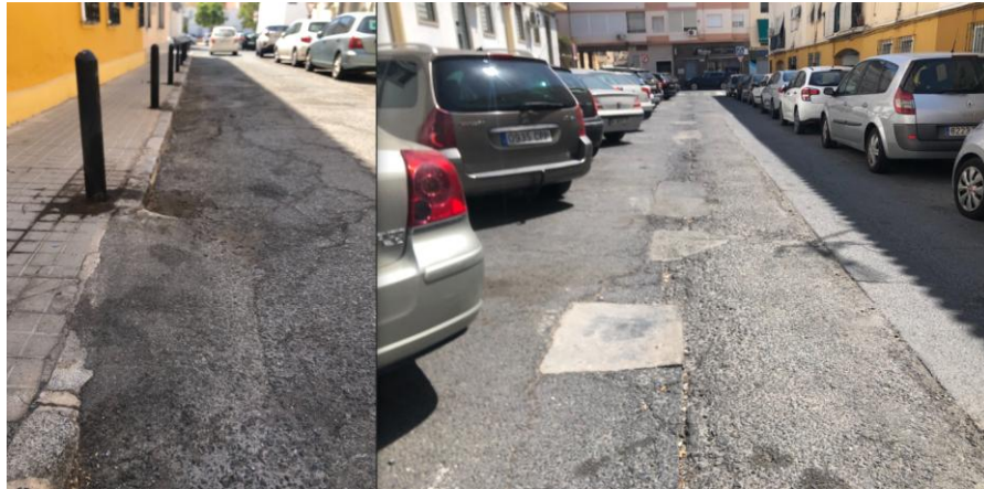
* Estado del asfaltado de la Calle Islas Maldivas y Vulcano.

La reordenación de la circulación en las calles Bonares y Argonautas es otra de las problemáticas que nos ha transmitido los vecinos. El Consistorio acometió en junio de 2020 labores para modificar los sentidos en las calles de esta zona con el fin de agilizar la circulación. Sin embargo al cambio a doble sentido de estas dos vías ha restado seguridad a los conductores que circulan por la zona puesto que en muchas partes de la calle el paso para dos coches es muy estrecho y se han llegado a producir varios choques entre los mismos. Sobre todo en algunos cruces donde solo hay espacio para un vehículo.