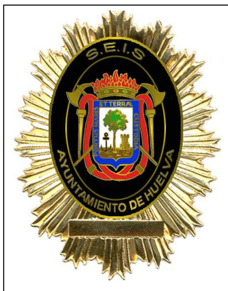
(Placa insignia a escala real)

Placa en PVC. De igual forma y elementos que la placa metálica. Confeccionada en PVC inyectado o similar. Todo el conjunto se colocará sobre un soporte de material plástico, fieltro o similar. Las medidas serán iguales a la placa metálica excepto el grosor que será de 2 milímetros.