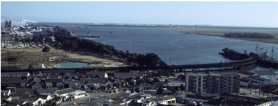
Vista del “Muelle del Tinto” (aún completo) en 1971

El desmantelamiento de ese tramo, cortando por la mitad el muelle, es un claro ejemplo de cómo se ha tratado a esta ciudad a lo largo de su historia, menospreciando la defensa de su patrimonio.