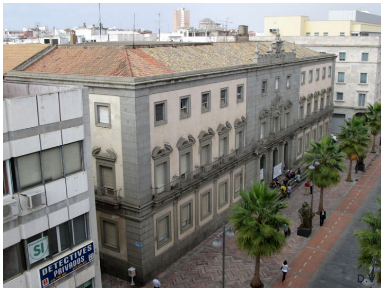
Antigua Delegación de Hacienda en Huelva.