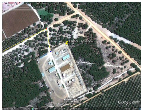
Planta de procesamiento Poseidón de REPSOL. Los gaseoductos discurren por zonas de especial conservación de Doñana y conectan con los de GAS NATURAL.

La Junta, de la misma manera que concede autorizaciones fraccionadas a GAS NATURAL, concedió hace un año la Autorización Ambiental Unificada a una NUEVA actividad parcial y fraccionada de REPSOL, el “Proyecto de Planta Móvil de Tratamientos de Aguas de Formación en la Base de Poseidón en Huelva