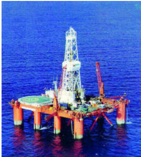
Plataforma Poseidón Norte, usada para la apertura de los pozos poseidon frente a las costas de Doñana.

gaseoductos de la empresa GAS Natural, que discurren dentro de zonas LIC y Zonas de Especial Conservación de Doñana.