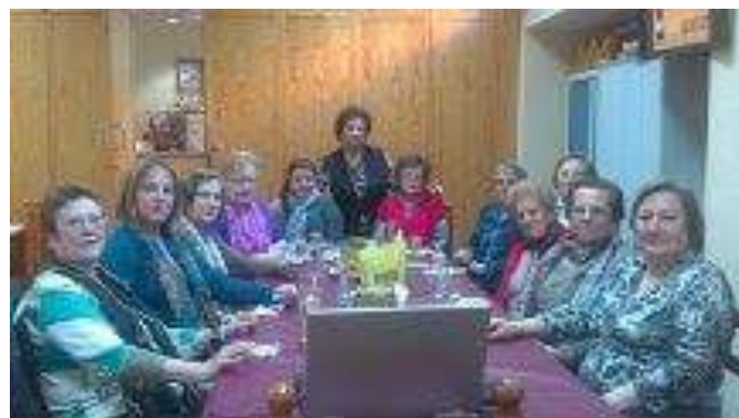
Taller de creatividad y de memoria

Ahora necesitamos además del apoyo moral, el económico (cuando se pueda) ya que hay temas culturales que necesitan en algunas ocasiones personal especializado para llevarlo a cabo. Todo esto teniendo en cuenta las dificultades económicas que tenemos y que necesitamos.