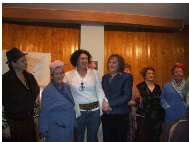
8 de Marzo, Día de la Mujer, pequeña obra de teatro alusiva al día

Aunque estos años se ha participado mucho en todo lo relacionado con cultura, en talleres, charlas, jornadas de tema de interés para la mujer, es cierto que uno de los talleres que más se demanda a la Asociación es el de Crecimiento Personal.