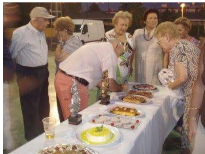
Concurso Gastronómico en las Fiestas de Santiago Apóstol

Sede en C/Fuenteheridos s/n. Molino de la Vega. Huelva