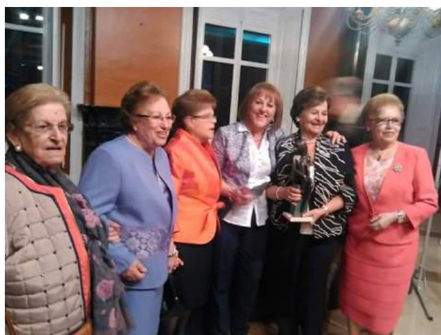
Entrega de Premio Marismas

En este momento contamos con 230 socias, son mujeres de 50 años en adelante. Nuestra asociación está organizada de la siguiente forma: somos una Junta Directiva de 8 mujeres: Presidenta, Secretaria, Tesorera y 5 Vocales.