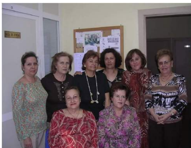
Grupo de Las Molineras, tarde de actividades lúdicas

Hemos recibido diplomas de la Concejalía de Igualdad por la colaboración del día de violencia de género. Y diploma de talleres que hemos hecho a lo largo de estos años.