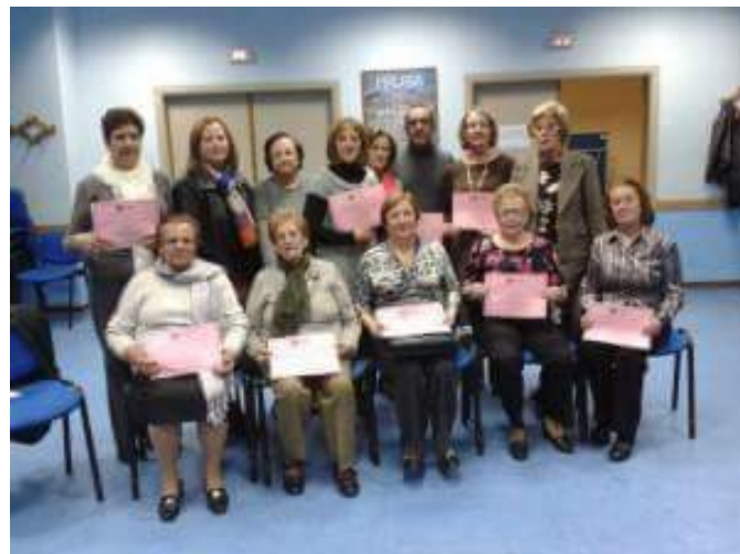
Clausura del taller "Hablar en público" y recogida de diplomas

Hemos recibido diplomas de la Concejalía de Igualdad por la colaboración del día de violencia de género. Y diploma de talleres que hemos hecho a lo largo de estos años.