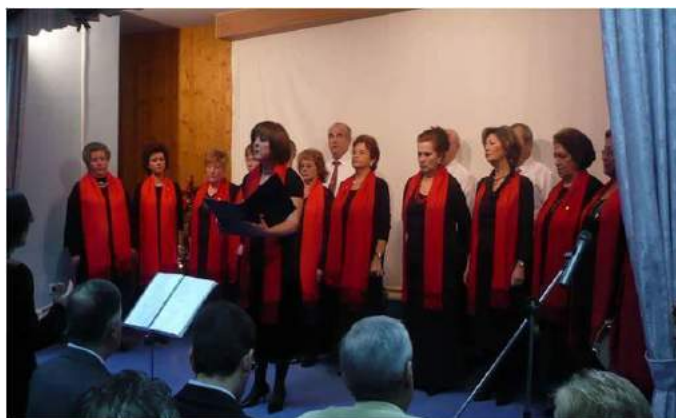
Coro de la Asociación del Molino, donde Las Molineras somos componentes

Las actividades lúdicas que se organizan en días de convivencia son conocer algún entorno donde a la vez podamos tener experiencias positivas y proponer entre todas algún deseo, además de esto llevamos haciendo grandes viajes. Hemos conseguido muchos logros en cuanto a la autoestima de las Socias. Hemos recibido algunos reconocimientos a lo largo de estos años como el premio Marisma, que nos concedió el Ayuntamiento, también otro premio colectivo por el Día de la Mujer que nos concedió el Partido Socialista, reconocimiento y colaboraciones con el Instituto de la Mujer, agradecimiento de la Asociación De Mujeres Santa Águeda.