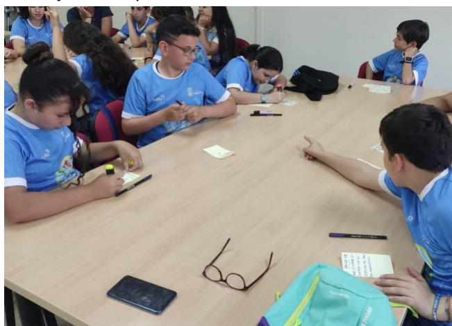
Figura 1: trabajo con el Consejo Municipal de Infancia de la Ciudad de Huelva (primera sesión)

El Pleno del Consejo Municipal de Infancia está compuesto por 10 niños y 14 niñas (24 en total), pertenecientes a 13 centros educativos de la localidad (Colegio Diocesano “Sagrado Corazón De Jesús”, Ceip Tartessos, Colegio Montessori Huelva, Colegio Cardenal Spínola Huelva, Cdp Virgen De Belén, Cdp Ciudad De Los Niños, Ceip Manuel Siurot, Ceip Reyes Católicos, Colegio Hispanidad, Colegio Santa Teresa De Jesús, Colegio Safa Funcadia, Ceip Giner De Los Ríos Y Ceip García Lorca).