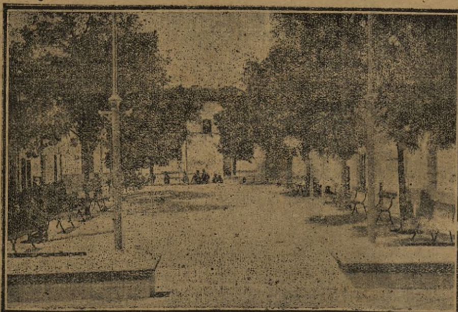
Plaza de la Constitución de la villa de Cortegana