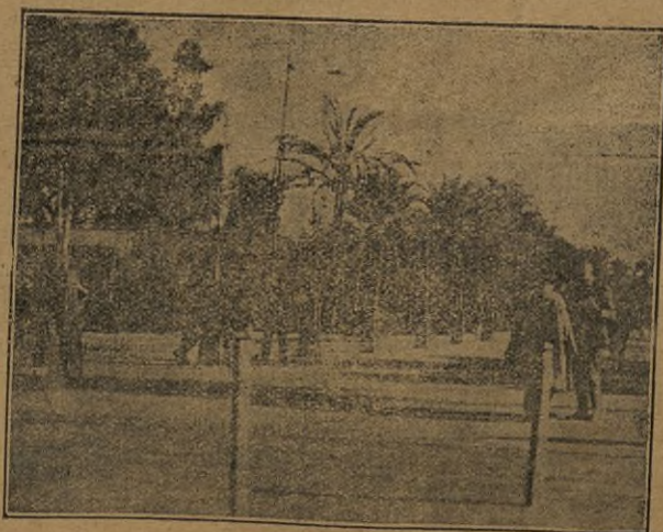
Paseo del Muelle, inundado por la erecida de la marea y las lluvias torrenciales del día de ayer