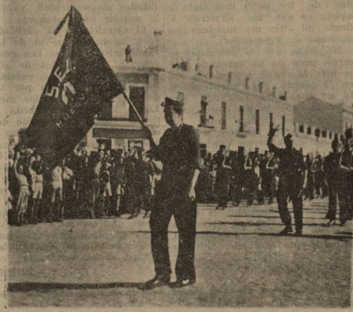
Los estudiantes de Huelva desfilan, en correcta formación, precedidos por la Bandera del S. E. U.

Por el progreso intelectual de nuestra Patria, tendamos a la aproximación de la Universidad a las clases populares.