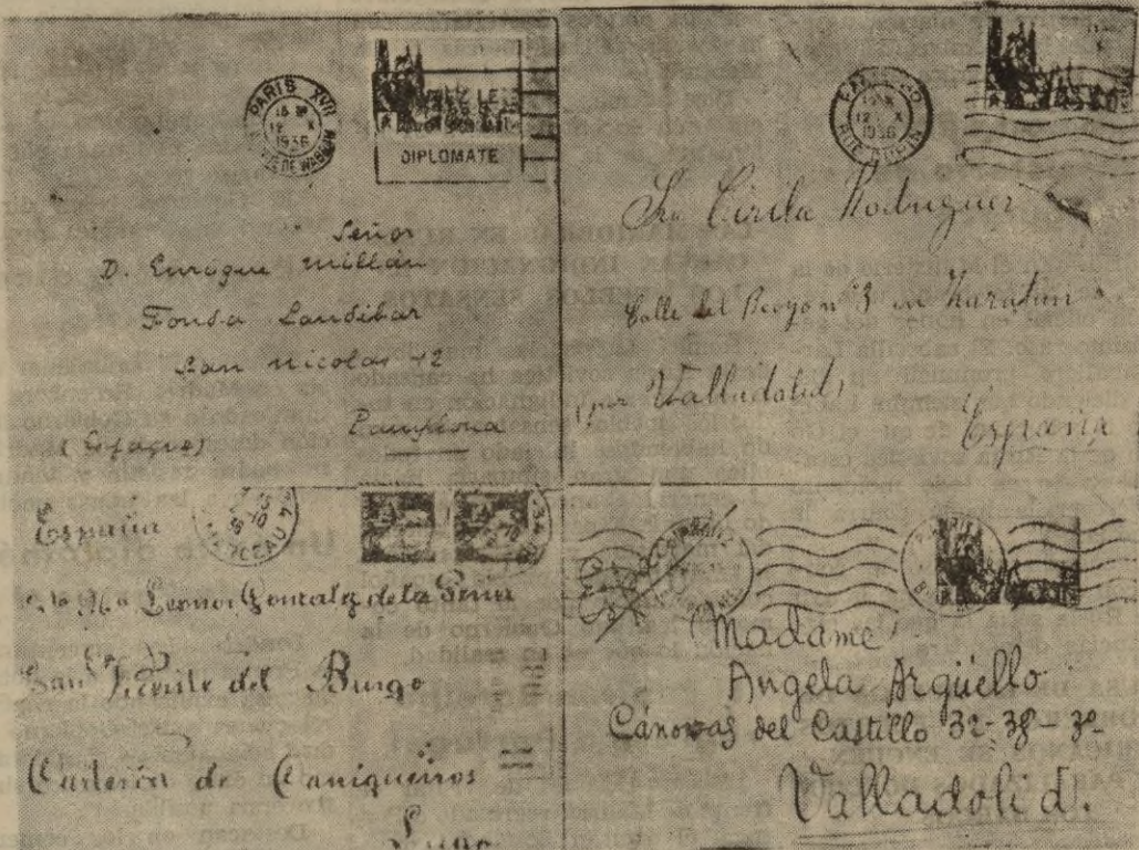
Facsimil de sobres de algunas de las cartas recogidas a bordo del vapor rojo "Galerna."

Informe facilitado por el Gabinete de Prensa y Propaganda de Burgos