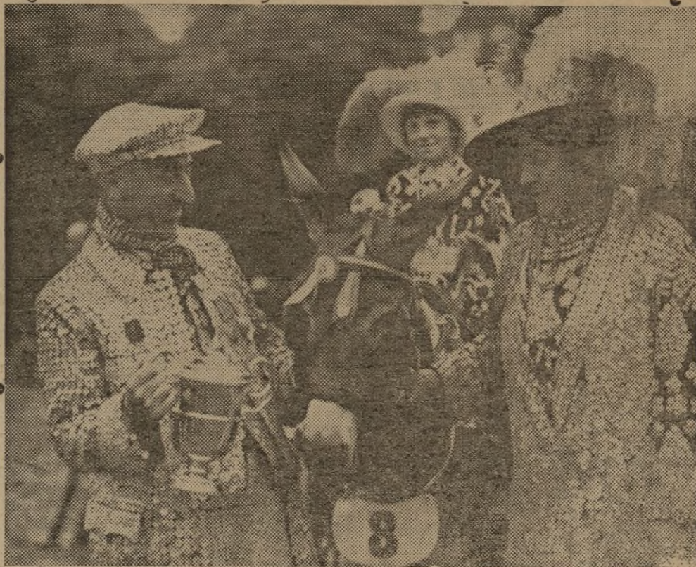
Los vendedores de pescado de Londres forman una secta llamada "Pearlies" y se distinguen por su vestidura cubierta de botones de nacar. Tienen a su rey el cual es elegido cada año. Anualmente celebran una fiesta en el gran parque de Kensington, donde exhiben sus caballos y burros. He aquí un pintoresco grupo.

to, con admirable sencillez los retornaron al encierro. Incorporados a la comitiva de Caidu, Cromos y sus más afectos capitanes regresaban lentamente todos a palacio, luego de repartir entre lo damnificados cuantiosas limosnas y todo género de consuelos.