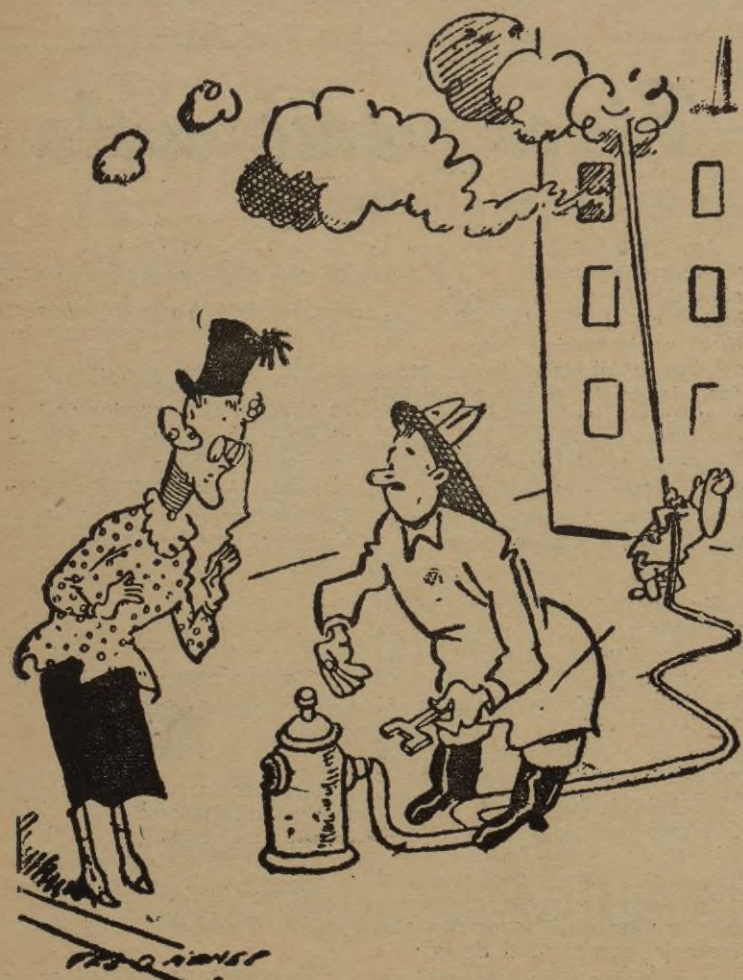
--Explíqueme esto, bombero. ¿Cómo es un recipiente tan pequeño puede caber tanta agua?