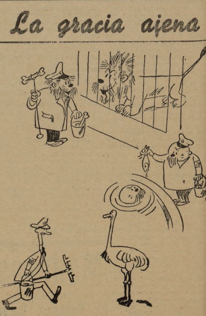
No deja de ser verdadera la teoría de que quien vive con un animal acaba por parecersele. (De "Fliegende Blätter" de Munich.)