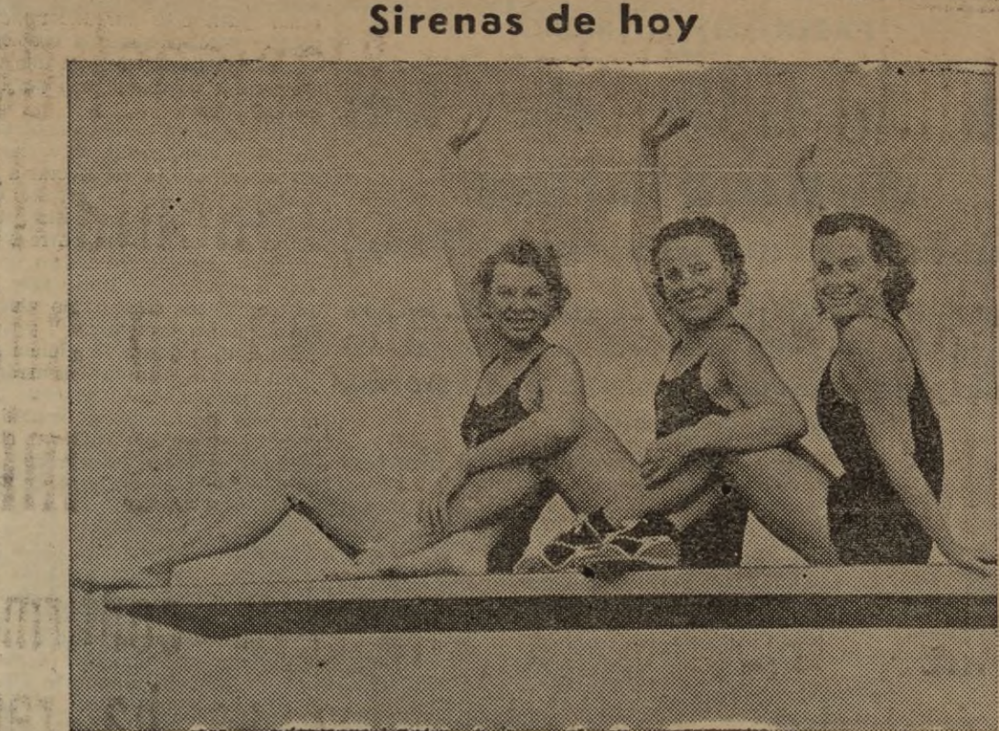
Estas tres muchachas plásticas de optimismo y juventud, integran el equipo de natación de los Estados Unidos que ostenta actualmente el record de los trescientos metros de relevo.