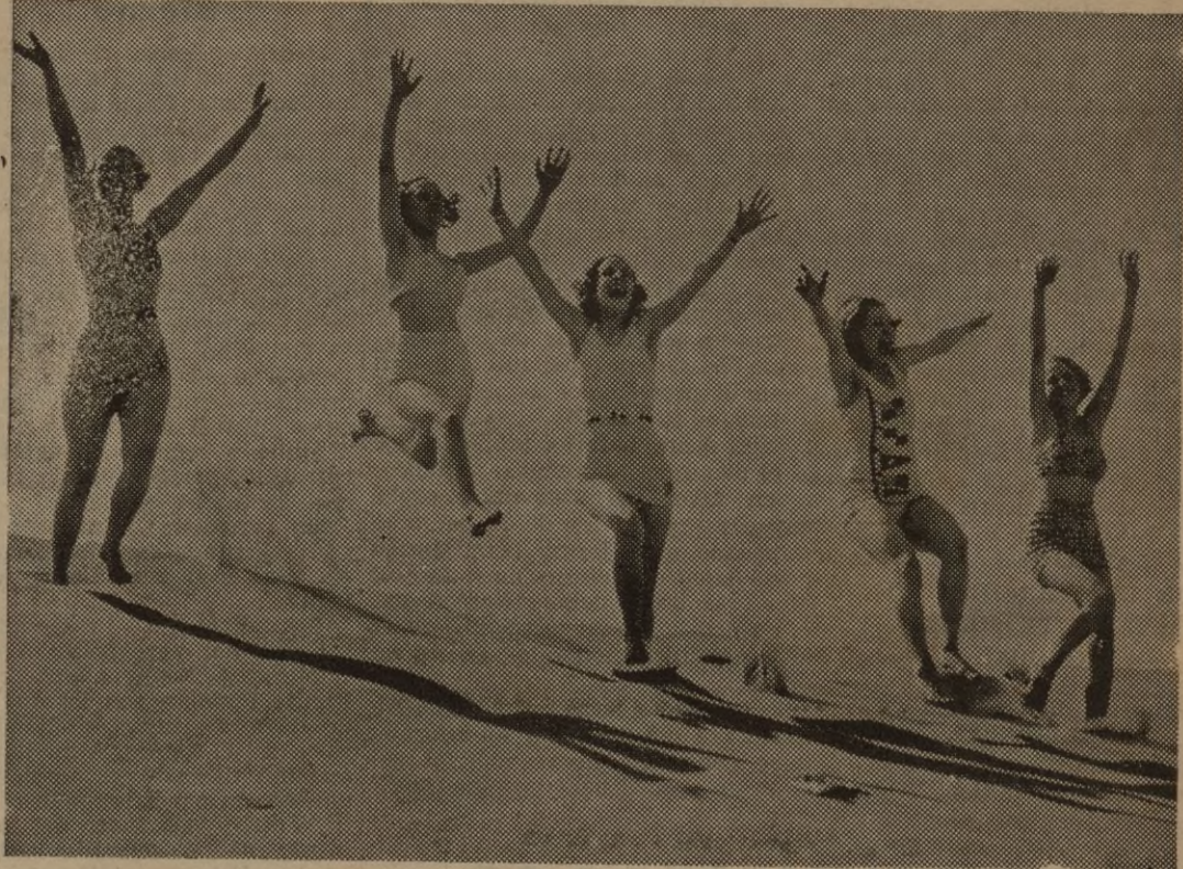
Ya las playas reciben gozosas con leves crujidos de arenas y suave murmullo de olas, a las primeras bañistas. Y ellas rién, y saltan alborozadas ante la naturaleza libre y salvaje frente al mar. (Express-Foto).