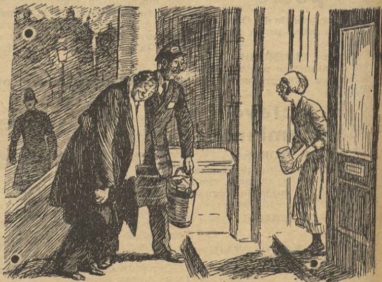
El lechero.--(a primera hora de la mañana).--¡La leche y el señor!