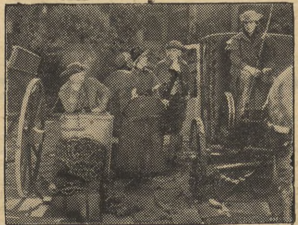
...descendieron del carruaje que se había detenido a la puerta de la tienda.

pavimento a beber el vino que manaba aún. Otros lo recibían del barril en el hoyo de la mano, bebiendo en el flujo. Un hombre llenó una pequeña taza y se la llevó a una mujer evidentemente enferma que estaba sentada en la acera con una criatura en los brazos. —Tiene barro, Gaspar —dijo ella débilmente. —¡Pero alimenta! —repuso él, y dió un trago a la criatura—.