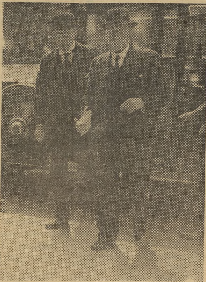
Recientemente el ministro de Colonias británico, Sir J. H. Thomas, presentó la dimisión de su cargo que le fué aceptada por el rey Eduardo VIII. Sir J. H. Thomas, entrando en Downing Street por última vez.