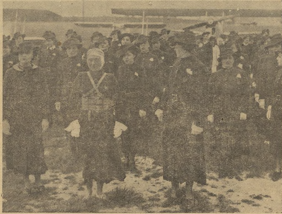
En el aeródromo de Guyancourt (Francia), ha tenido lugar la presentación de las primeras enfermeras destinadas a la aviación.