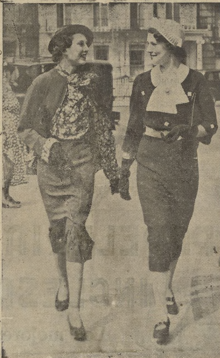
Estas dos señoritas que más bien parecen maniqués de una casa de modas son, sencillamente, las elegidas como anunciadoras por la B. B. C. de Londres, para el servicio de televisión que acaba de inaugurarse.