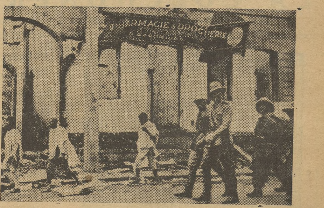
Cuando los italianos entraron en Addis-Abeba, encontraron más que una ciudad, un montón de escombros y ruinas, motivado por el saqueo de los abisinios en su huida. Esta "foto" es una prueba de ello.