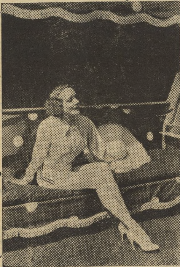
Marléne Dietrich, después de unos meses de intenso trabajo, se ha tomado unas merecidas vacaciones. Vedla descansando —aunque en una postura algo incómoda— en el jardín de su casa de Hollywood.