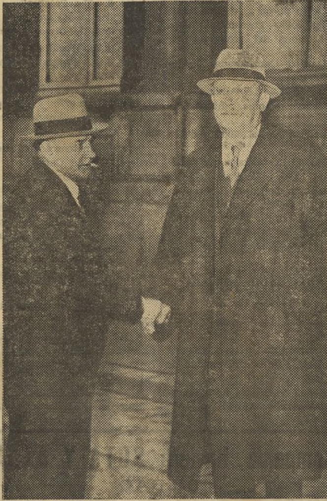
Los señores Blum y Deladier, saliendo del Ministerio del Interior después de conversar con el jefe del Gobierno, Mr. Alberto Sarraut.