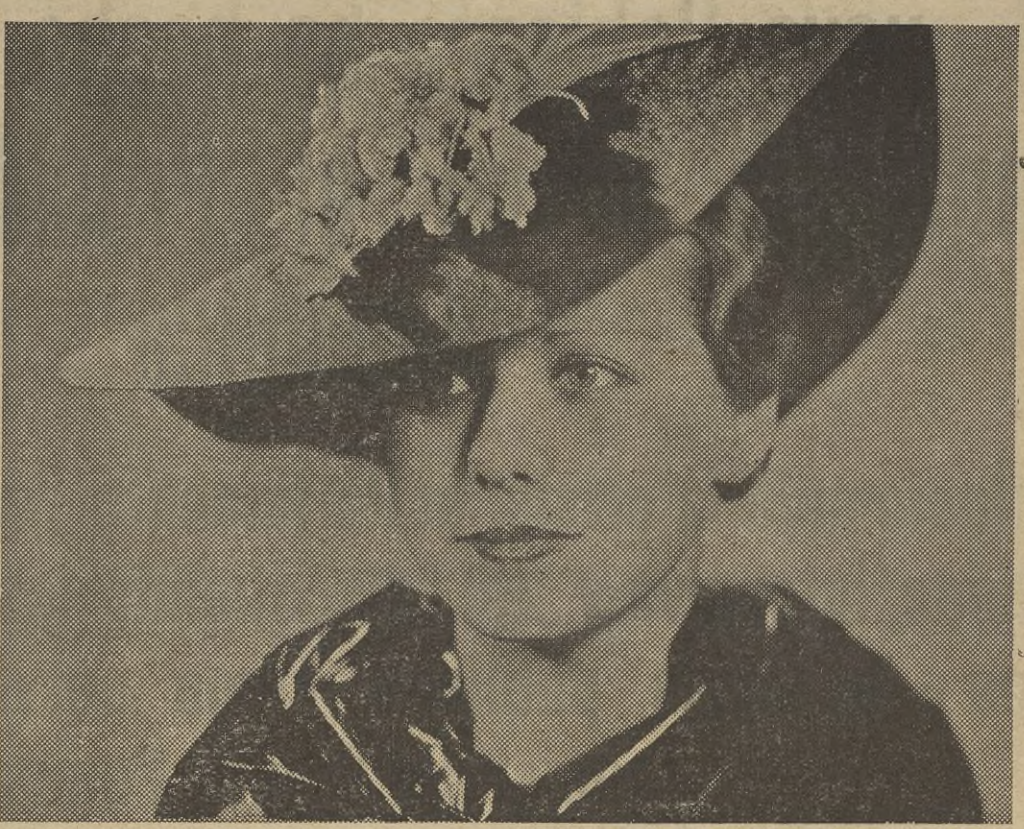
Bonito modelo de sombrero para la próxima temporada, hecho de paja negra, adornado con un ramo de flores.

Prepárese en coctelera: Unos pedacitos de hielo. Unas gotas de kirsch. Unas gotas de curacao. Unas gotas de vermout seco. Una copita de coñac. Se agita bien y se sirve en copa de cocktail. Prepárese en coctelera: Tres o cuatro pedacitos de hielo. Un tercio de vasito de kummel. Un tercio de vasito de coñac. Un tercio de vasito de whisky. Agítase y sírvase en copa de cocktail.