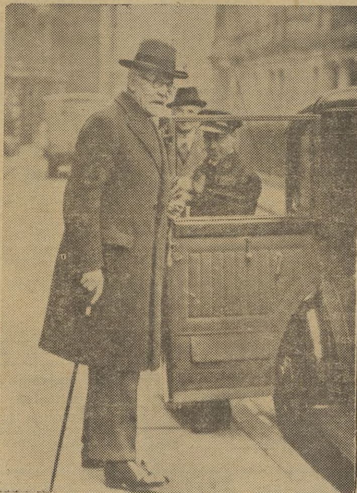
Mrs. Ramsay Macdonald, ex primer ministro británico, saliendo de la clínica londinense donde ha sufrido una intervención quirúrgica. El estado de Mr. Macdonald es muy satisfactorio