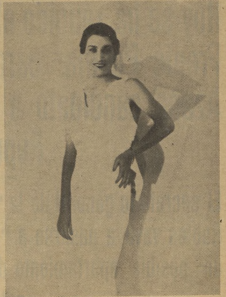
MISS UNIVERSO 1936