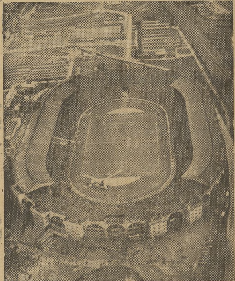
Vista del estadio de Wembley (Inglaterra) durante el partido de fútbol celebrado entre el Arsenal y el Shepfield para disputarse la final de la Copa de la "Asociación del Fútbol" que dió la victoria al Arsenal por 1 a 0.