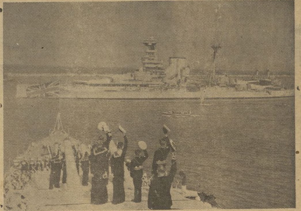
El buque-almirante de la escuadra inglesa "Queen Elizabeth" a su salida del puerto de Alejandría de regreso a Inglaterra, es saludado por la tripulación de los buques de guerra británicos que se encuentran en aquellas aguas.