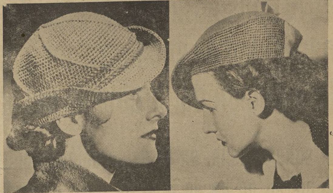
Para aquellas mujercitas cuyos maridos ponen el grito en el cielo cuando le piden un nuevo sombrero, ofrecemos hoy estos dos lindos modelos confeccionados con papel crepé.