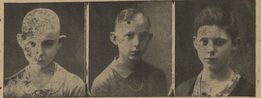
4 años calvo