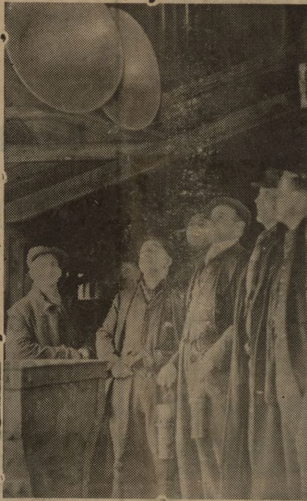
El pasado domingo tuvo lugar en Alemania el plebiscito por medio del cual más de cuarenta y cuatro millones de habitantes aprobaron la política internacional de Hitler...