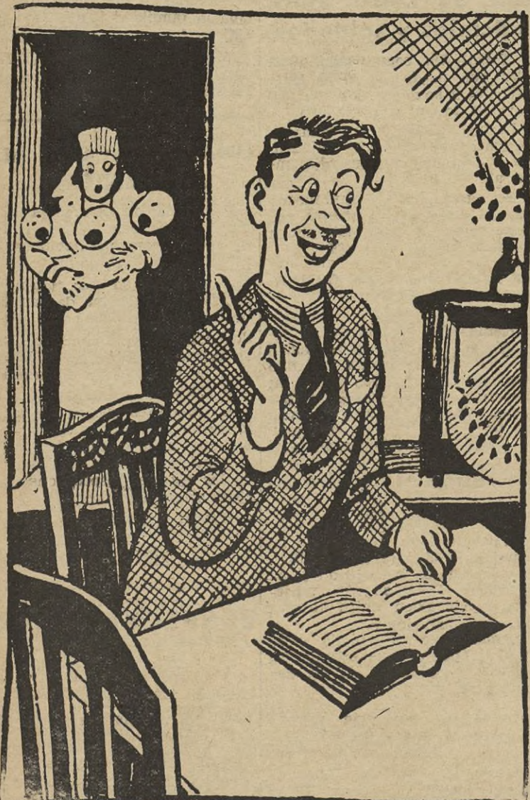
EL PADRE.—Aguarde un momentito; déjeme que adivine. ¿Una niña o un niño?