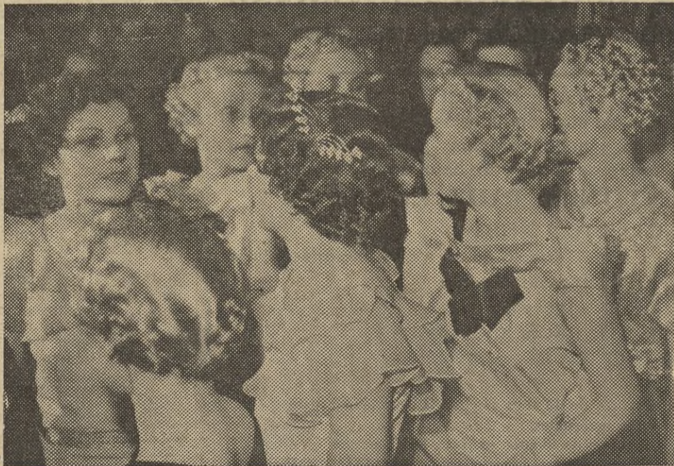
En un elegante salón de París se ha celebrado un concurso de peinados en el que presentaron sus modelos los más afamados peluqueros de la Ville-Lumière. En la "foto" vemos a varios modelos de los muchos presentados.

Prepárese en coctelera: Hielo picado. Seis u ocho gotas de Angostura. Media copita de vermut. Media copita de dry gin. Agítese y sírvase en copa de cocktail.