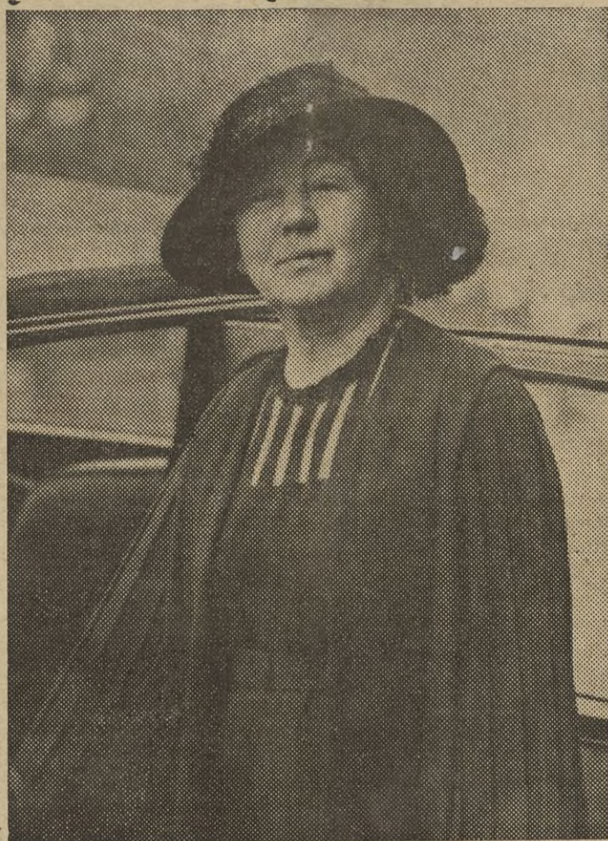
Uno de los actos democráticos que ha celebrado el rey Eduardo VIII, desde su ascensión al trono británico, ha sido entregar la insignia de Dama de Honor del Imperio Británico a Miss Christabel Pankhurst, una de las primeras mujeres sufragistas de antes de la Gran Guerra. La ceremonia se celebró en el Palacio de Buckingham.