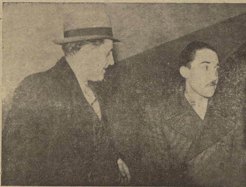
Paris.—El juez Mr. Linais interroga a uno de los supuestos cómplices en el atentado que hace poco fué víctima el diputado socialista francés Mr. León Blum.

mente por intermedio del aire que rodea al enfermo en un radio de un metro a uno y medio, según el sitio en que se encuentre. Este contagio es más frecuente en los locales cerrados como las habitaciones, teatros, cinematógrafos, escuelas, colegios, cuarteles, iglesias, casinos, etc., donde se reúne gran número de personas.