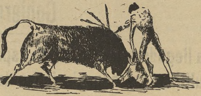
UNA ESTOCADA DEL "NENE" (Apunte de Pepe E. Casto)