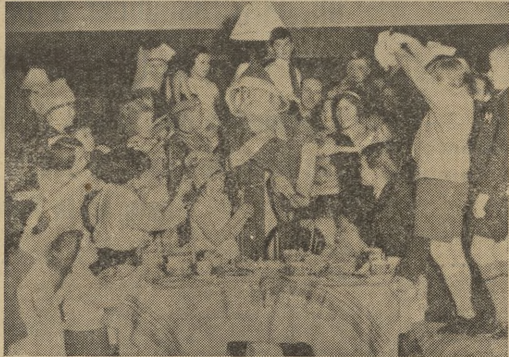
LILLIAN HARVEY EN UN "NUEVO PAPEL"

Con motivo de las fiestas de Navidad la conocida actriz de la pantalla Lillian Harvey ha invitado a los niños de su distrito a una espléndida merienda vistiéndoles ella de madre Noel. Lillian Harvey, junto con los niños, repartiéndoles chocolates y dulces que hicieron la alegría de los pequeños.