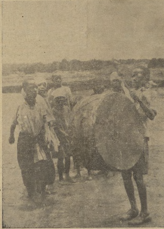
En Etiopía como en toda el África Oriental, es costumbre que los chiquillos en las fiestas de Navidad vayan en grupo tocando un tambor a las puertas de las casas, correspondiendo los vecinos a la algarabía infantil con regalos de Pascuas.