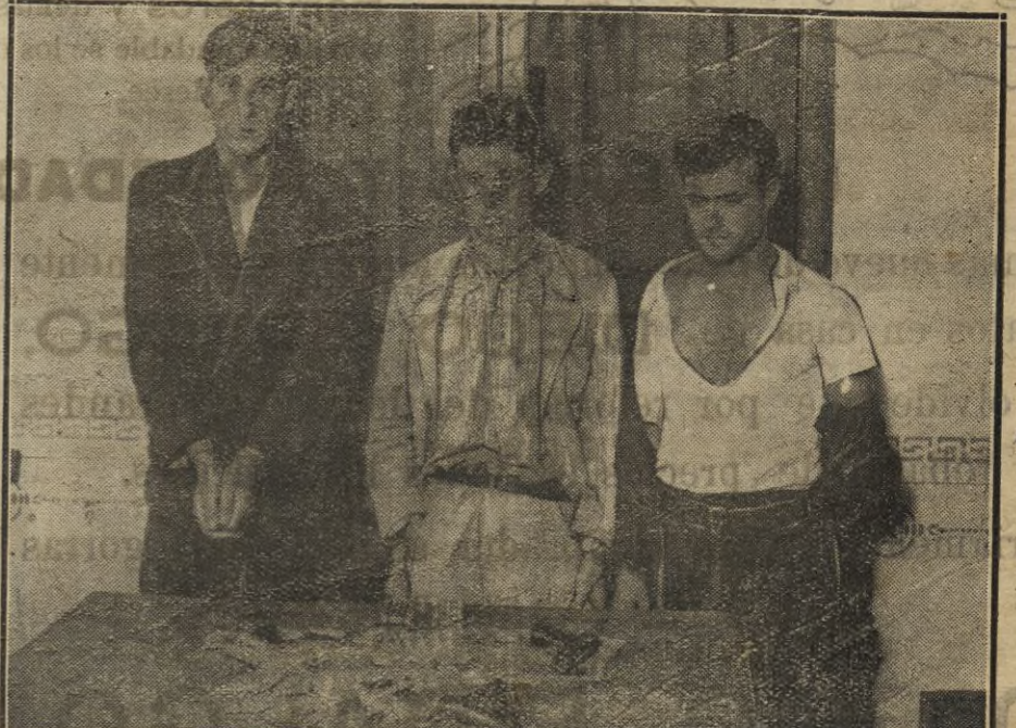
DEL ATRACO A UN BANCO

Han sido denunciados por llevar abiertos los escapes dentro de la población a pesar de las órdenes dadas por el gobernador civil los automóviles de las matriculas y números siguientes: CA-4.106, H-1.211, MA-5.574, SE-15.593, H-1.680, H-4.473, H-1.513, H-1.733 y H-1.643.