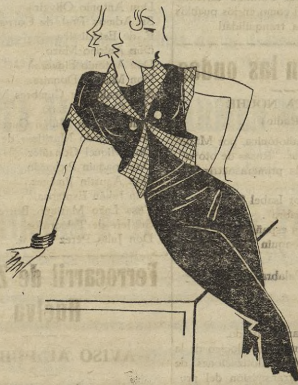
Modelo muy a propósito para deportes en azul marino y cuadritos en rojo.

La crema grasosa que resulta de esta mezcla es excelente para emplearse durante el masaje y puede también aplicarse al párpado inferior de los ojos y en las comisuras de la boca, donde la piel de la cara tiene marcada tendencia de ажarse, dejándola toda la noche para que lubrifique estos tejidos y le oblique a recuperar el vigor perdido.