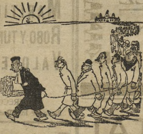
El juez de instrucción tiene excesivo trabajo y prefiere terminarlo en casa después de cenar. (De "Ric et Rac").

El Gran Stok de Trajes confeccionados para Caballeros y Niños por las más importantes casas de Madrid y Barcelona, confección esmerada Trajes Caballeros bien confeccionado de lana desde 40 Ptas. en Driles hilo de todas clases . 18 . Pantalones para playa blancos clase Extra . 10 . de Lana Tennis de varias clases . 12 . Camisas de ordelines, popelines y seda de marcas acreditadas y patentadas . 10 . Para vestir bien y barato la Sastrería y Camisería Antonio Fidalgo En prendas confeccionadas de todas clases no buscar más que esta acreditada casa Artículos de regalos, Viaje, Género de punto y Perfumería Joaquín Costa, 7.-HUELVA Es la Casa que mejor Sastra tiene y más barato vende