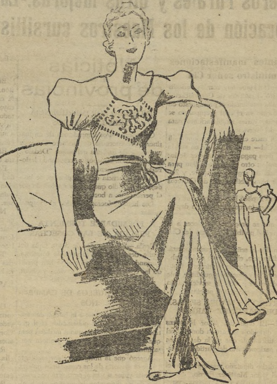
"Des-habillé" de terciopelo blanco adornado de un superpuesto bordado en satén