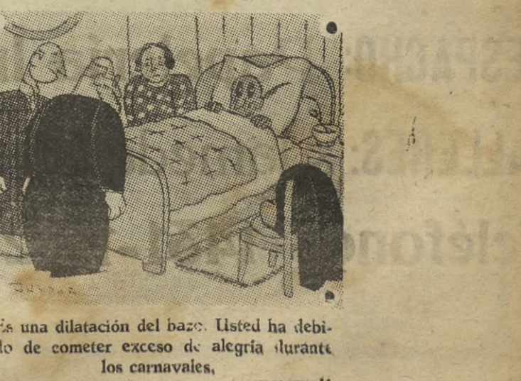
Es una dilatación del bazo. Usted ha debido de cometer exceso de alegría durante los carnavales.