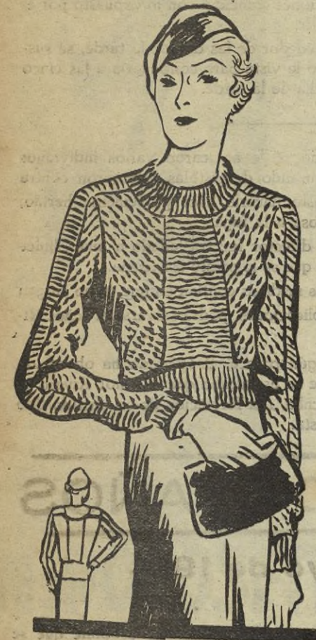
"Sweater" de lana gruesa y cuello vuelto. Este modelo está confeccionado con lana chinesca beige.

Los sombreros que nos presenta la moda actual se distinguen por su forma característica, que es solamente de esa temporada. Los más nuevos, inspirados en la moda clásica.