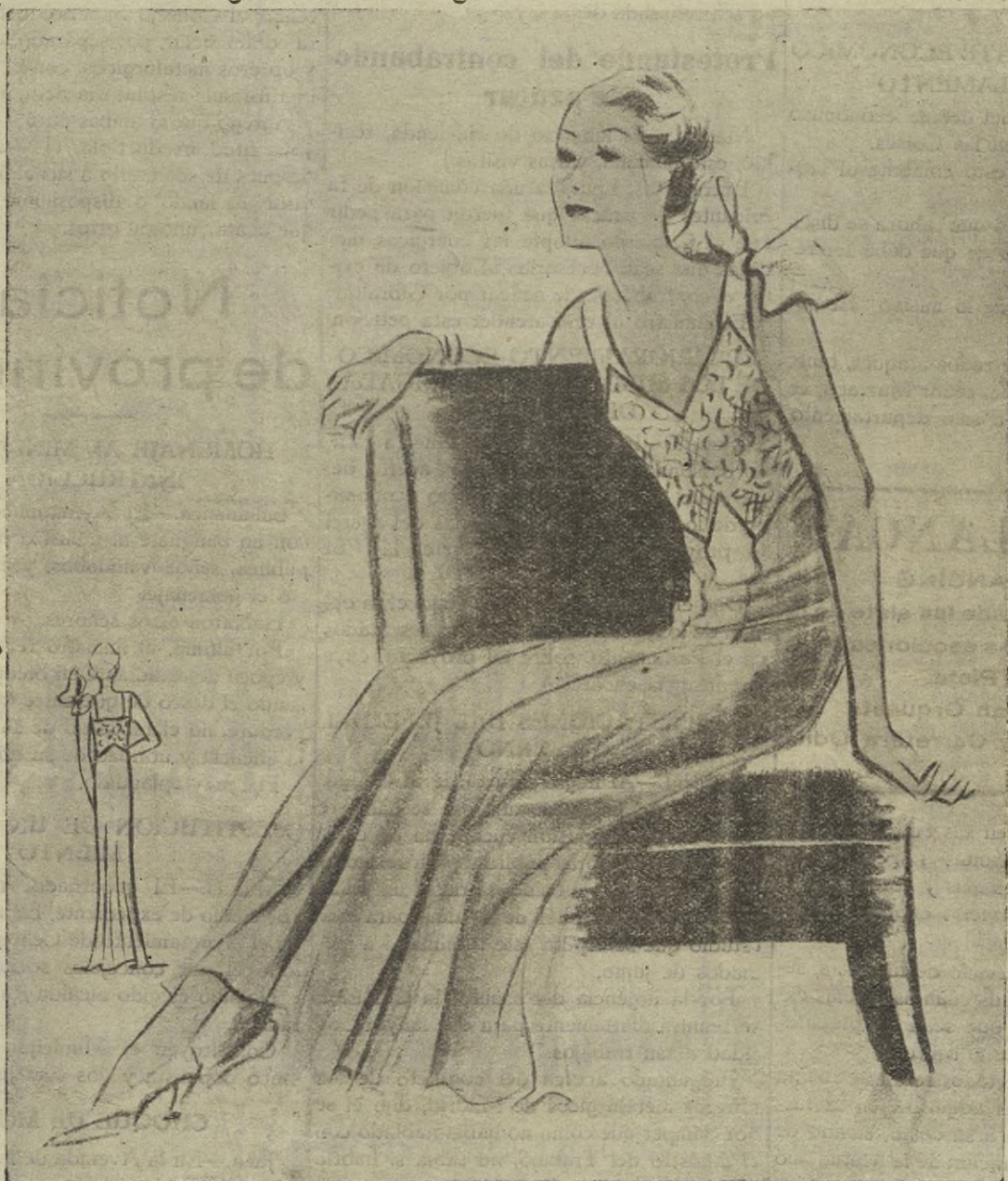
Camisa de noche en crepé de lana china con adornos de puntilla

Un pedazo de gamuza mojado en agua fría y retorcido después, es lo mejor para limpiar los muebles finos, porque, no solo los raya, sino que, además, borra las huellas de los dedos.