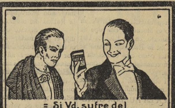
= Si Vd. sufre del