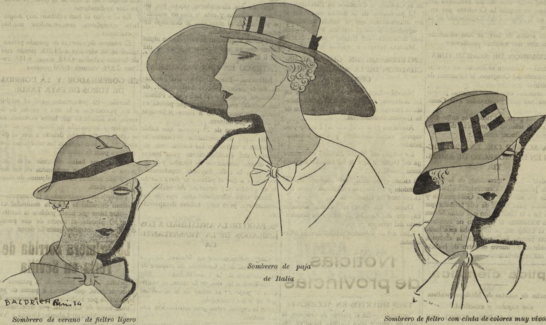
Sombrero de paja de Italia