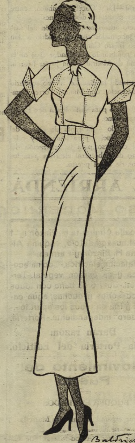
Vestido de "après-midi" verde botella. Este modelo es muy apropiado para los días templados de la primavera.