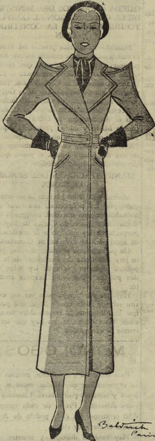
Abriego de sport muy apropiado para viajes en automóvil.

El miércoles próximo aparecerán las contestaciones a las interrogantes de esta semana.