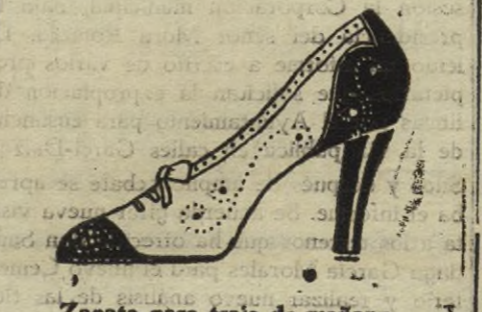
Zapato para traje de mañana