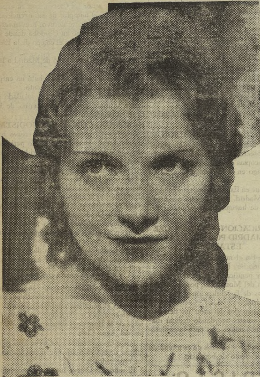
Peggy Shannon, uno de los más encantadores rostros de Cinelandia