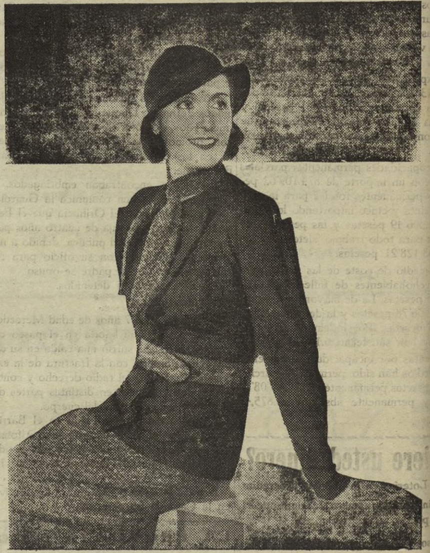
Dorothea Wlack, se destaca en el mundillo de Hollywood como una de las más expresivas y de mayor elegancia

"LA PROVINCIA" publica durante la semana amenas e interesantes secciones: Lunes, DEPORTES; Martes, TAURINAS; Miércoles, PARA LA MUJER; Jueves, ACTUALIDADES; Viernes, LO QUE TRAEN LAS ONDAS y Sábado, CINE.