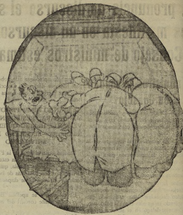
—Tenga usted un momento.