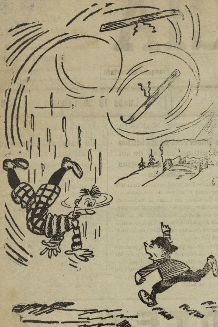
—¡Eh! ¡Que se deja usted los esquiés!

La nueva fecha del encuentro será la del día 26 del presente mes de febrero.