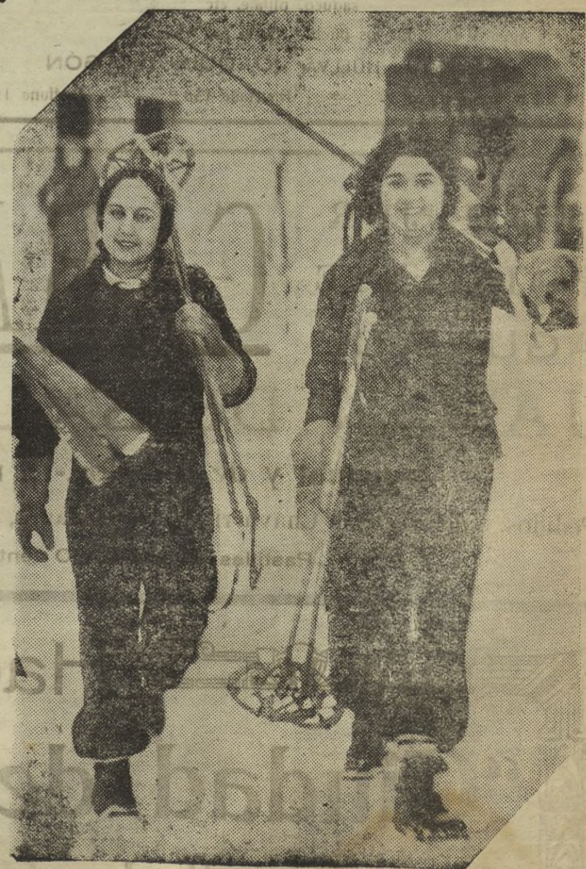
Dos intrépidas esquiadoras, bonitas como puede verse, de los miles de serranas que los domingos pueblan las nevadas del Guadarrama, luciendo sus dotes de patinadoras, andaliegas y elegantes atavíos.