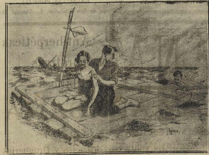
¡Maldita sea mi suerte! ¡Un polizón!