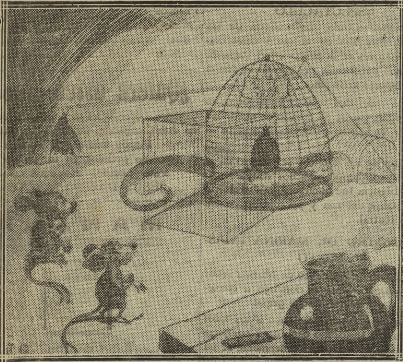
—Me doy por vencido. ¿Por dónde entra?