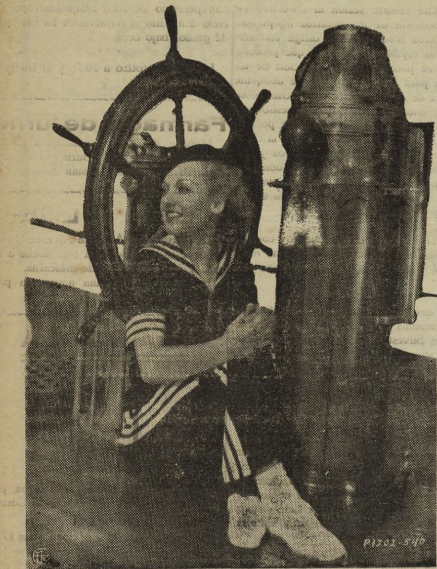
CAROLE LOMBARD, es una encantista del mar. Véala aquí entrenándose en manejos náuticos

La cinta está muy bien realizada. En ella se nota movilidad, acción, en una palabra: CINE. No en vano la ha supervisado Martínez Sierra que a su antiguo prestigio de comediógrafo insigne, une las enseñanzas que le han dado los balbucesos y errores de cintas anteriores a "Una viuda romántica".