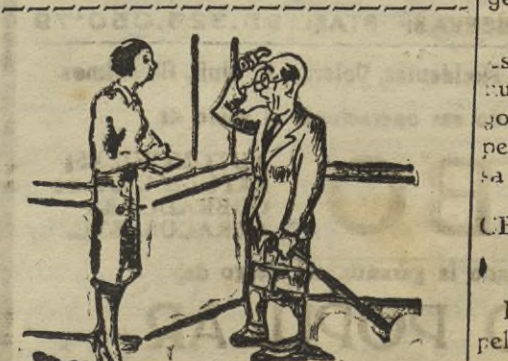
—Desoaba comprar un sombrero. —En el segundo piso, espionaje de antigüedades.