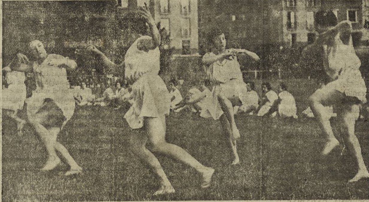
Muchachas pertenecientes al Club Femina Sport de Paris, ejecutando danzas físicas en el Stadium Elisabeth (Francia).